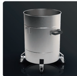
سطل زباله استنلس استیل