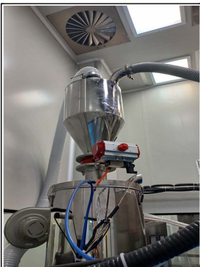
اتصال به دستگاه BFS