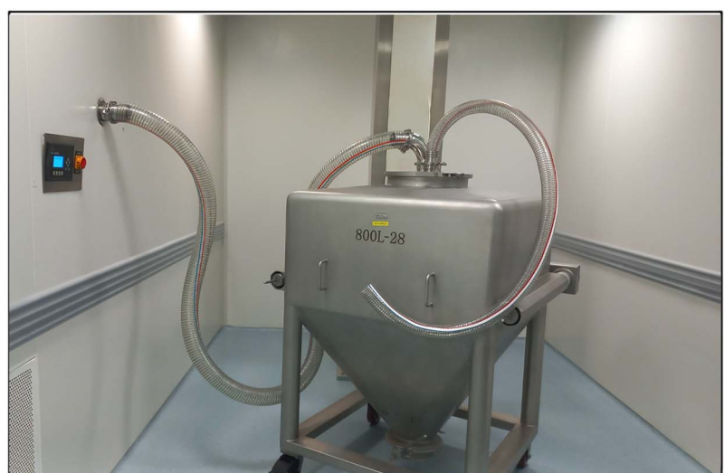
انتقال پودر به بین بلندر